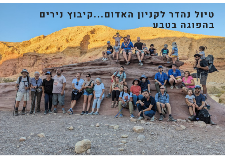
טיול נהדר לקניון האדום... קיבוץ נירים בהפוגה בטבע

בימים אלה אנחנו מייצבים את מערכות הקיבוץ השונות ומגבשים שגרה מותאמת לתקופה זאת. הנהלות, ועדות וצוותים חוזרים לפעול, תוך התאמה ושילוב עם הפונקציות החדשות שנוצרו ונדרשות לצורך השהות, ותוך הבנה שבעת הזאת גם נדרשת הרבה גמישות, פתרוןות תוך כדי תנועה ותגובה מהירה. בקהילה – משאבים רבים מופנים לעבודה מול מינהלת תקומה ומול הגופים השונים העוסקים בבנייה מחדש של קיבוץ העוטף. אנו פועלים מול מס רכוש, גופי התכנון, המועצה, רמ"י, החטיבה להתיישבות ועוד.