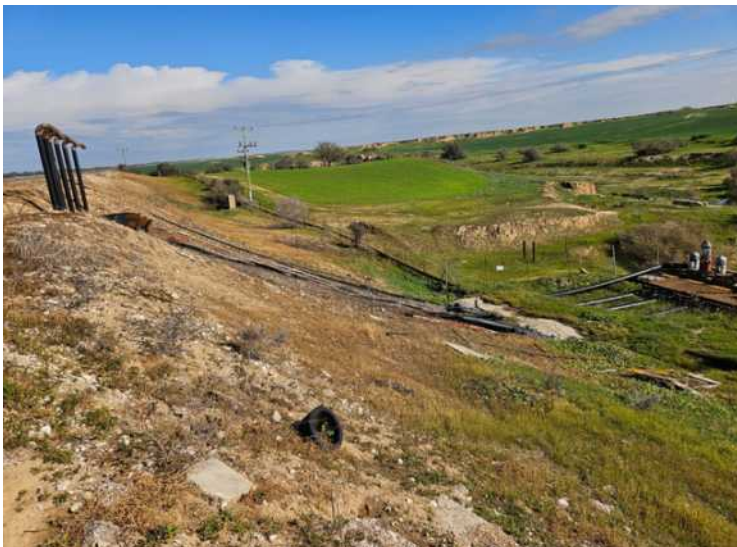
המשאבות של המאגר עם הצינורות השרופים