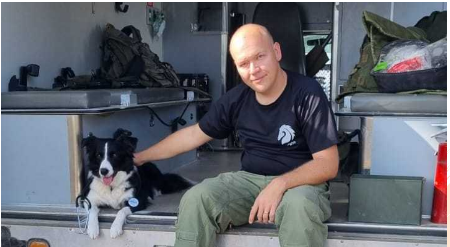
תמונה של הכותב במילואים במסגרת חרבות ברזל

אנשים ששואלים אותי "האם אתם חוזרים לנירים?" הרבה פעמים מופתעים מתשובה החד-משמעית. בעיניי שיקום הקיבוץ אחרי המלחמה זה חלק בלתי נפרד משיקום כל אחד כפרטים.