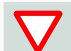
302 (ב-37) 301 (ב-36) תן זכות קדימה לתנועה בדרך החוצה