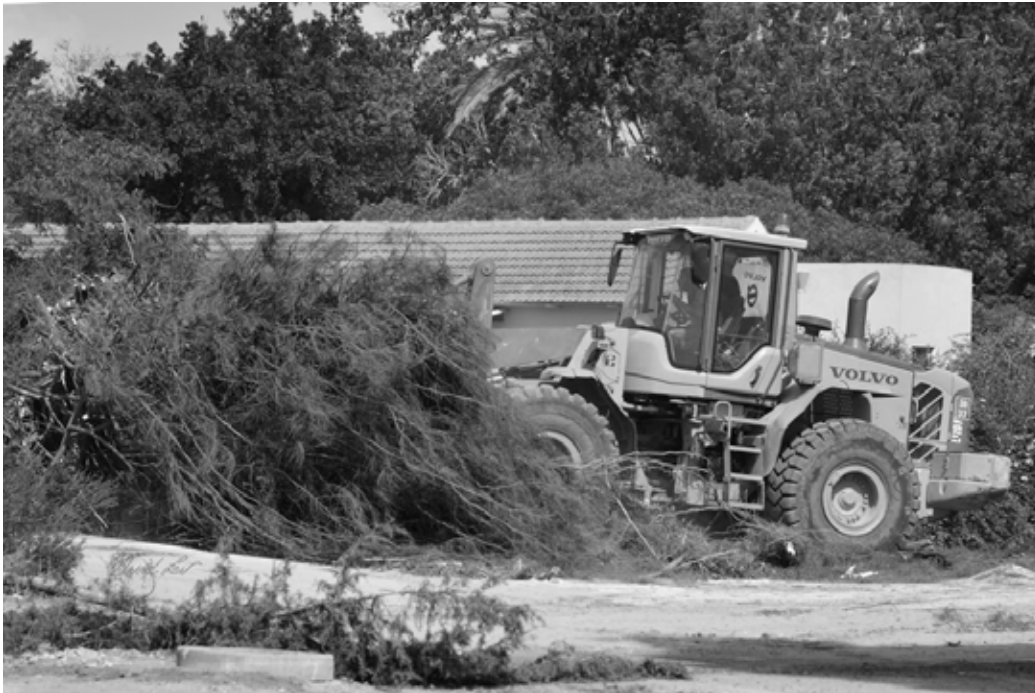
הלכה פְּרָקִינְסוֹנְיָה שְׁכָנִית.

רחוב נחלת העבר פינת העתיד, או פינת מוטי המטייל - נחלת בנימין. את הפנייה יש לבצע אחרי גני שרייבר (שילוט מתאים במקום).