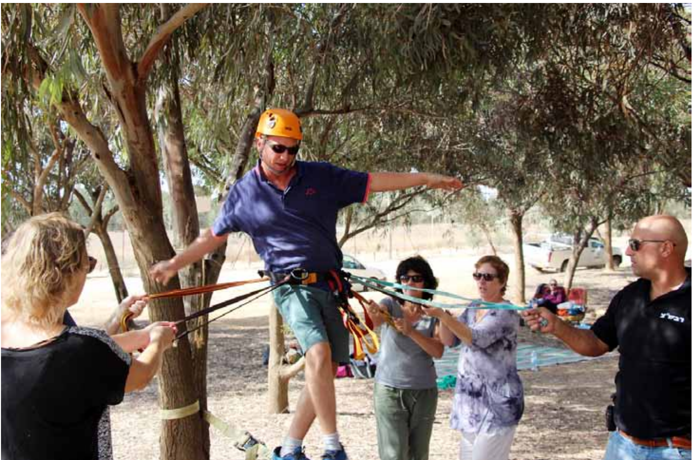
חברי צח"י נירים באימון/גיבושון בכרמים.

צוות העלון: אירית חפץ, גליה קרמר, נמרוד חפץ, ארנון אבני.