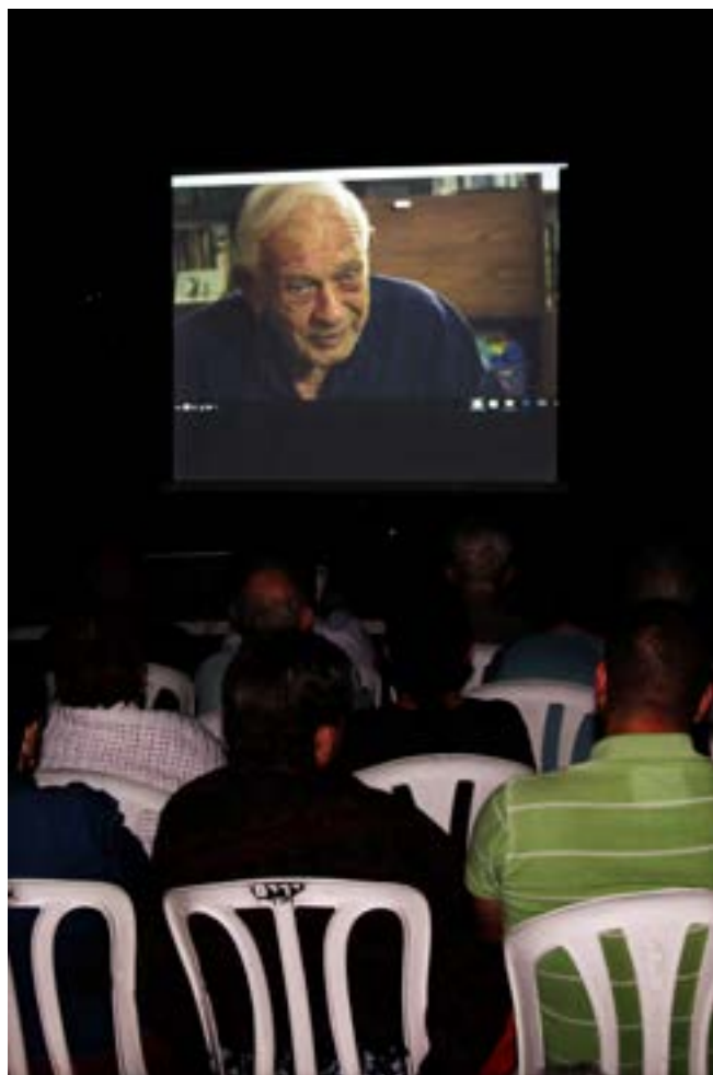
הסרט בהקרנת בכורה בנירים

תודה לכולם, לעושים במלאכה לעמותת להב וליושבים כאן.