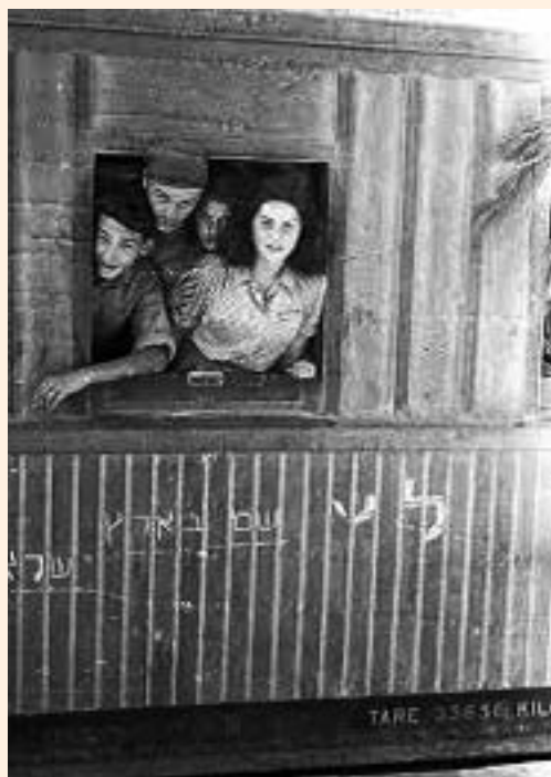
ילדי טהרן מגיעים לעתלית

בעתלית היינו כמה שבועות, שם קיבלנו טיפול של אחיות ושל סוציולוגים, ופסיכולוגים. חילקו אותנו לקבוצות, בעיקר לבתי ספר חקלאיים, הקבוצה שלי נשלחה