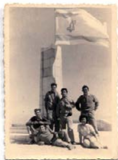
כתה ט' בגניגר