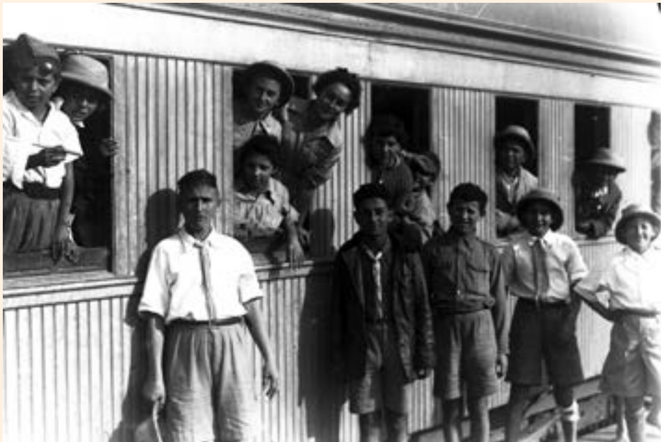
ילדי טהרן מגיעים לעתלית

היינו בקאראצ' שלושה שבועות ועלינו על אוניה נוספת, "נארליה". הים היה ממוקש כולו, עברנו אימונים למקרה והאוניה עולה על מוקש וטובעת חולקנו לסירות הצלה והיו לנו חגורות הצלה. יום אחד היתה אזעקת אמת, כולנו התייצבנו ליד הסירות, ראינו צוות בריטי יורד עם סירה ומזיז עם מקלות את המוקש. האוניה עברה לאט ליד המוקש, אחרי המעבר הזה היתה הקלה ושמחה גדולה. יום אחד ראינו מטוסים