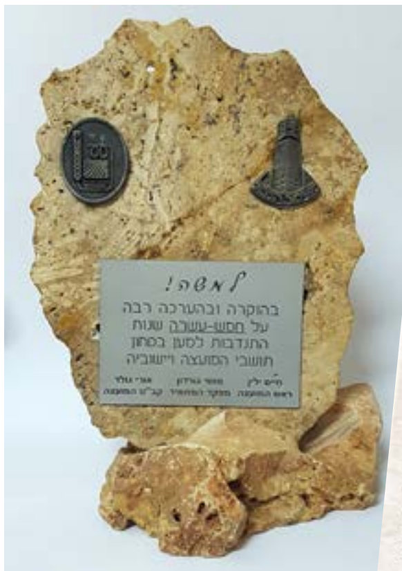
מגן הוקרה שניתן למשה בסיום 15 שנות התנדבות במתמיד

חמש עשרה שנות התנדבות במתמיד הגיעו לסיומן, ועל כל השעות והימים בהם סיירנו, שמרנו, הבטנו על השדות המחליפים צבעים בעונות השונות, אולי יספר מישהו אחר ברבות הימים.