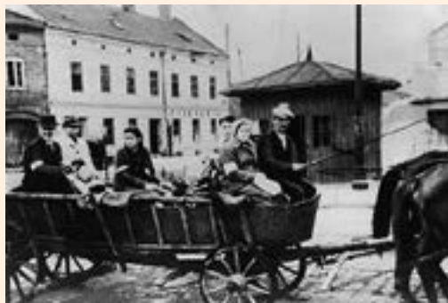
פליטים על כרכרה

קיוונו וחיכינו לרוסים. בעת שציפו לבוא הרוסים תושבי הכפר החליטו לגמור חשבון עם השוטרים הפולנים שהיו שנאים עליהם והרגו את כולם. במקום הצבא הסובייטי הגיע לכפר קורפוס של חיילים פולנים שנסוגו מהסובייטים, כשהם ראו מה עשו לחבריהם השוטרים הם עשו שחיטה. אספו את כל הגברים, יהודים ואוקראינים, לכיכר המרכזית, לקחו ליער וחסלו אותם. איך