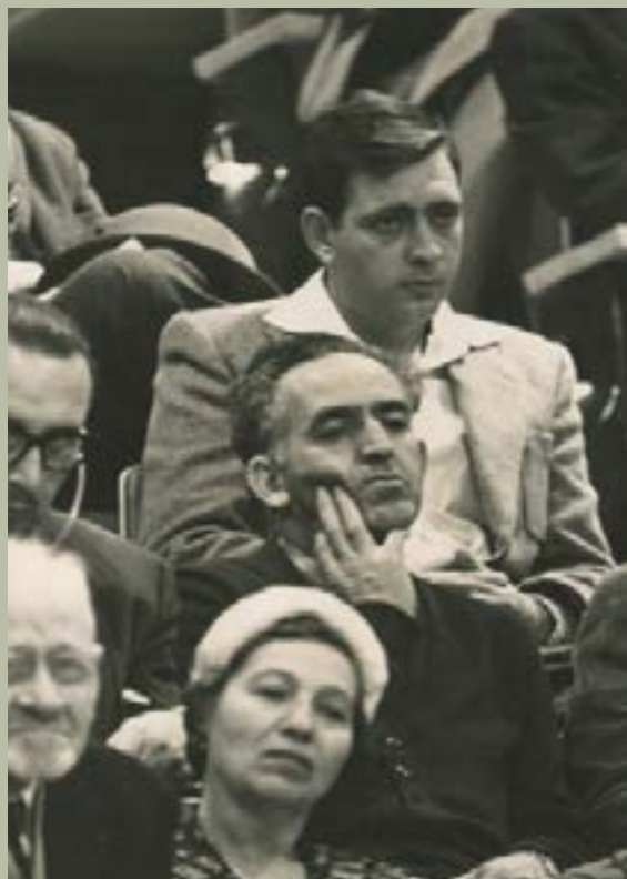
בזמן משפט אייכמן

ועתה לזכרונותי ממשפט קסטנר. (קסטנר היה דמות שנויה במחלוקת שמצד אחד הציל יהודים רבים מאד ומצד שני נחשד בשת"פ עם הנאצים). ישראל קסטנר נרצח ב-1957 ע"י זאב אקשטיין, בחקירתו השתתפו שני החוקרים, שהיה ידוע לכל אנשי השירות, שאם