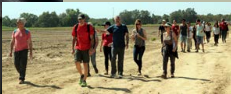
צעדת 'בשבילם' 2016