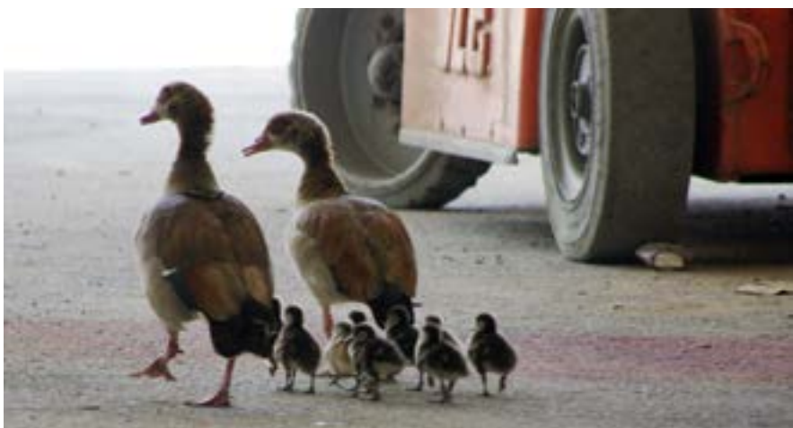
יאוריות בבית האריזה בנירים

קשה לשכוח אירוע כזה, שמצד אחד הוא כואב ודרמטי ומצד שני סך הכל די מצחיק.