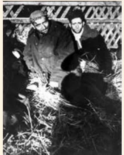
פליטים יהודים באוזבקיסטן

שיטת הרכבות בברה"מ פעלה כך: התחנות הגדולות נבנו על גבעה, ק"מ אחד או שניים מהעיר. ממנה יצאו מסילות לכל הכיוונים. מגיע הקטר, אתה מודיע לאן אתה רוצה, וכשהוא אוסף מספיק קרונות שנוסעים לכיוון הוא יוצא לדרך. ככה שאתה לעולם לא יודע מתי יבוא קטר וכמה זמן תיסע. אתה רתום לקטר עד שהוא צריך לנסוע לכיוון אחר, אז מנתקים