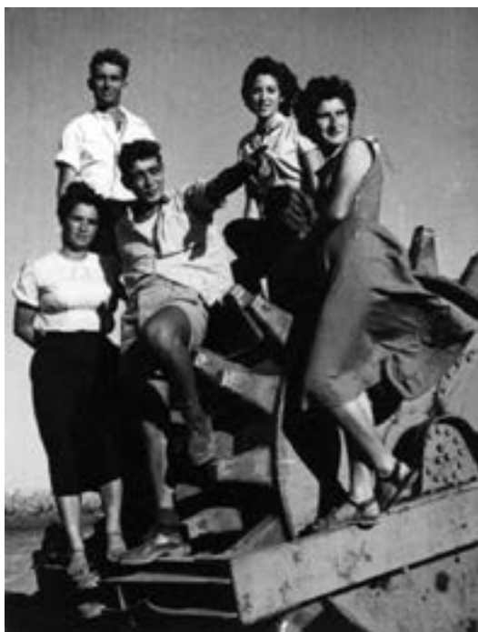
באגם הקישון 1953 עם בני הקבוצה

אגב בחיפוש זה בצעתי את עבודת המודיעין הראשונה שלי. נשלחתי כילד, שלא ישמו לב אליו, לספור כמה משוריינים הגיעו ומהי כמות