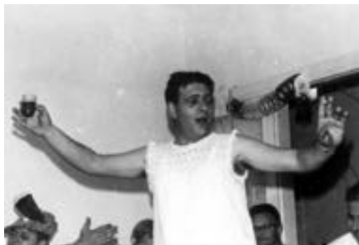
חגיגה בגבעתיים: שנות השישים העליזות

שנים ארוכות מאד, גם כשכל אחד פנה לדרכו ולמקום אחר בארץ, המשכנו להיפגש לקומזיצים, בעיקר בימי העצמאות. כשילדינו התבגרו הם בקשו לשנות את זמני הפגישות כיון שרצו לבלות את ימי העצמאות עם חבריהם. תאריך הקומזיץ השנתי של חבורתנו הועבר לשבת הראשונה אחרי ל"ג בעומר. הפגישות נמשכות כבר עשרות שנים, ובהתאם לשינויי העתים, ההתארגנות עתה היא דרך WhatsApp. בני דור המייסדים הולך ופוחת, הארגון עבר מזמן לדור הבנים. תוך הצטרפות של הדור השלישי והרביעי, בתקווה שהמסורת תמשך.