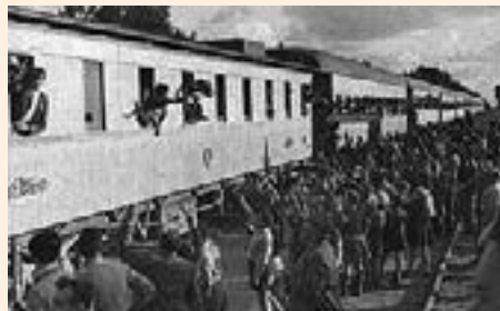
ילדי טהרן מגיעים לעתלית

בטהרן עומדת רכבת, בידי שוטר בריטי רשימה ובה שמות אלו העולים לארץ ואני לא מופיע בה, בגלל המחלה. השוטר עומד על המדרגות ומקריא שם ושם והנער ששמו מוכרז עולה לרכבת. אחי בא אלי ואומר "כשמקריאים את השם שלי (של אחי), אתה עולה". שאלתי: "ומה איתך?" "תעזוב, תעלה", ענה לי. וכך עשיתי. כשקראו בשם שלו עליתי. כשהסתיימה הרשימה וכולם עלו, אחי ניגש לשוטר ושאל: "למה לא