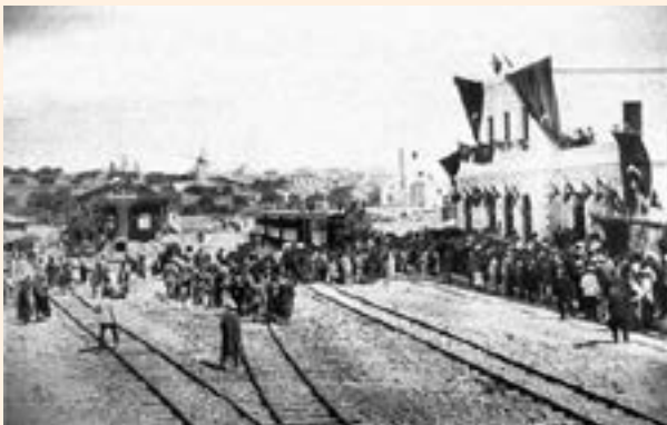
תחנת רכבת ברוסיה

לא מתפרנסים. אבא ואחי מצאו עורות של חיות, עשו מזה מין רגל קרושה וניסו למכור בתחנת הרכבת. רוסים התנפלו עליהם, היכו ולקחו הכל. כל אחד חיפש