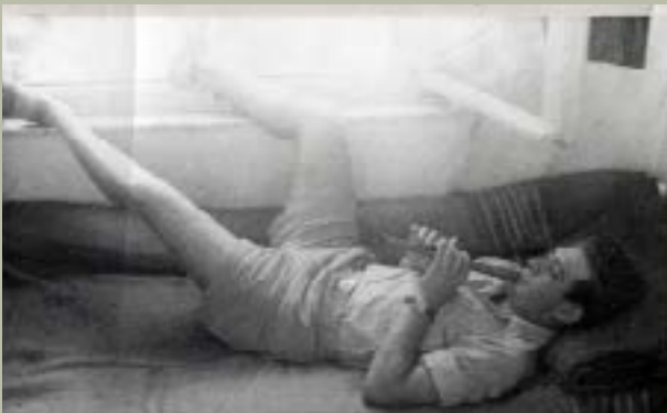
מנוחת צהריים מוסיקלית תא 1953

ב- 1953 נשלחתי מטעם שירות הביטחון לאבטח את ביקורו של מזכיר האו"ם דאג המרשלד שהגיע לפגישות עם ראש הממשלה דוד בן גוריון. בשדה בוקר. היתה זו פגישה היסטורית. לצורך אבטחת המפגש צורפתי לאיש שרות וותיק. הייתי מגויס צעיר והיה לי לכבוד גדול לקבל תפקיד זה. מלבד שמירת ביתו של ראש הממשלה, היה עלינו לאבטח את צעדת הבוקר של בן גוריון ואורחו המכובד. הלכנו בצמוד אליהם וחיילי הנח"ל שמרו מהגבעות על מסלול הליכתם לאורך הדרך. דאג המרשלד היה גבר שוודי גבוה ורזה ואילו בן גוריון היה נמוך ממנו בהרבה, אך צעד במרץ רב ובמהירות.