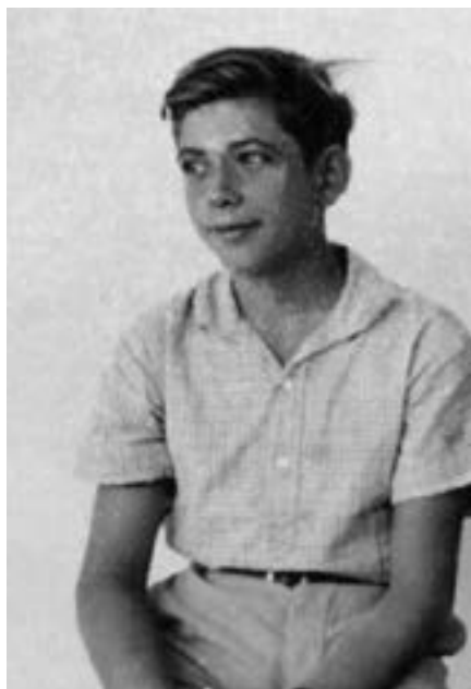
כתה ח' בגניגר, לפני המעבר למקס פיין